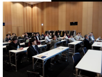
口頭発表 & 質疑応答