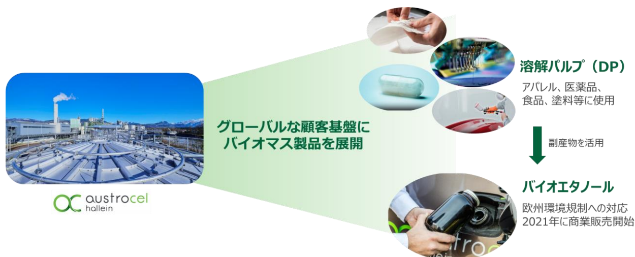
AustroCel社のビジネスモデル図