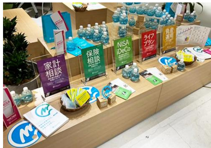
テーブルにはマネードクターグッズやチラシを展開