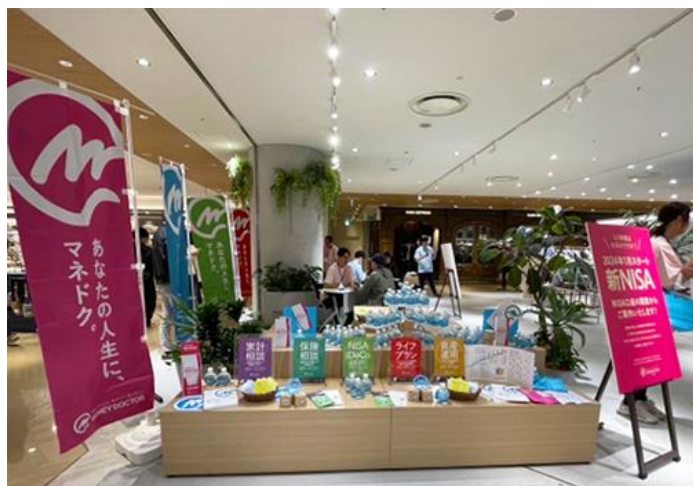
ルクア イーレのイベントスペースに構えた相談ブース

相談は終始和やかなムードで行われ、お客さまからは、「興味はあるけど、何から始めたら良いのかわからない」「すでに始めてみたものの、制度の内容が理解できていない」といったお悩みの声も寄せられ、新 NISA への関心の高さがうかがえる3日間となりました。