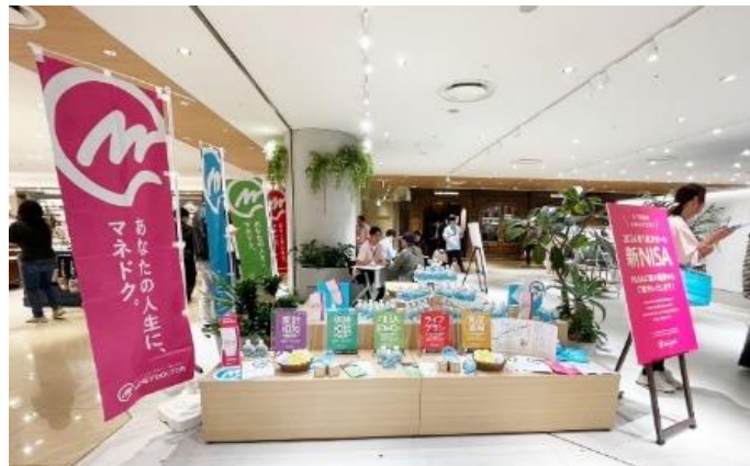
【過去開催の様子】ルクア イーレ（大阪）

当社FPは、参加者の皆さまにNISAをより身近に感じていただくことで、資産形成・資産運用に関心を持っていただき、参加者お一人おひとりのライフプランを叶えるサポートを行います。今後も各地でNISAに関するイベントを開催し、金融リテラシー向上に貢献してまいります。