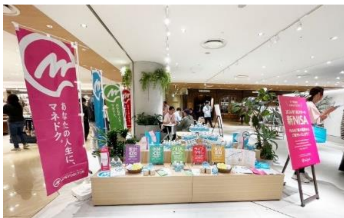
【過去開催の様子】ルクア イーレ（大阪）

当社FPは、参加者の皆さまにNISAをより身近に感じていただくことで、資産形成・資産運用に関心を持っていただき、参加者お一人おひとりのライフプランを叶えるサポートを行います。今後も各地でNISAに関するイベントを開催し、金融リテラシー向上に貢献してまいります。