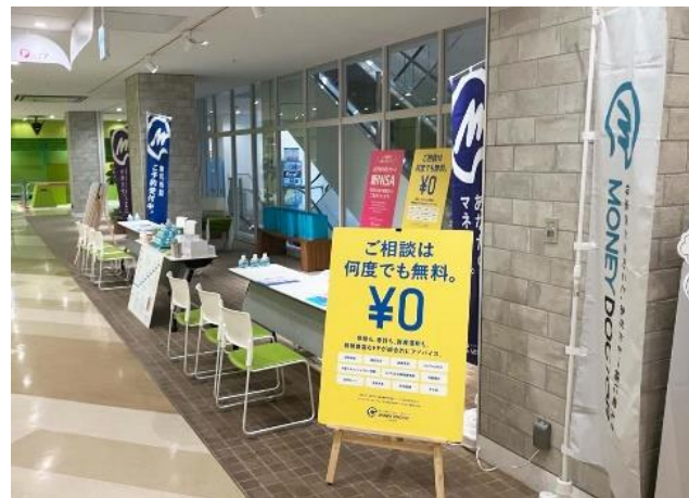
【過去イベント開催の様子】マークイズ福岡ももち

「お金のプロ」ファイナンシャルプランナーに、ライフプランや老後資金、NISA 含む資産形成等、お金に関するさまざまなことをご相談いただけます。ご家族等を交え、さらにじっくりと相談されたいという方には、後日の個別相談予約も承っております。相談希望の方はスタッフにお知らせください。