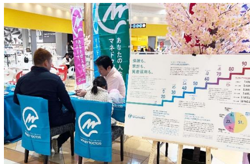
【過去イベント開催の様子】アリオ倉敷

マネードクタープレミアでは、ライフスタイルの変化に伴うお金の漠然としたお悩みやライフプラン、教育費、資産形成等、さまざまなお相談を承っております。将来のイメージを具体化するきっかけづくりとして、「POPUP イベント（ライフプラン相談会）」にお気軽にお越しください。